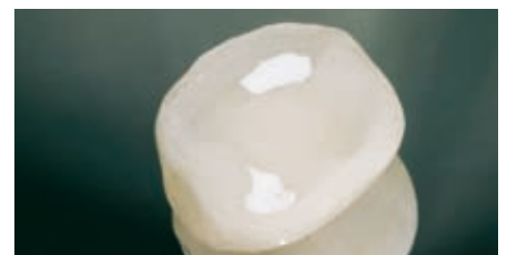
Silanisierte Teilkrone aus Glaskeramik.