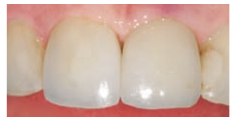
Einprobe mit Try-in-Paste.