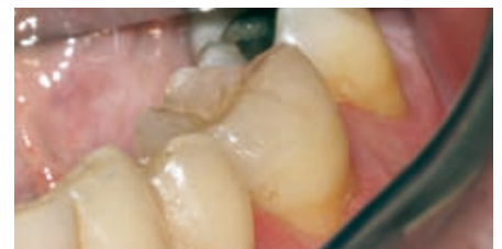
Fertig zementierte Teilkrone mit Vitique.