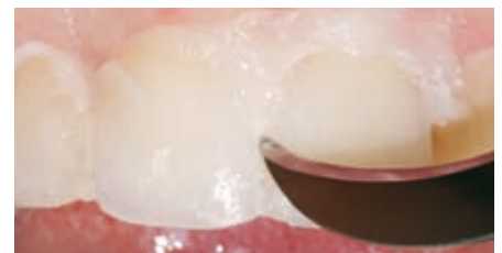
Überschussentfernung mit Scaler.