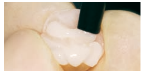
Zementieren einer Teilkrone mit Vitique.