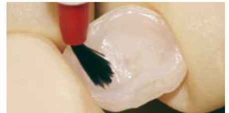
Silanisieren einer Teilkrone aus Glaskeramik.